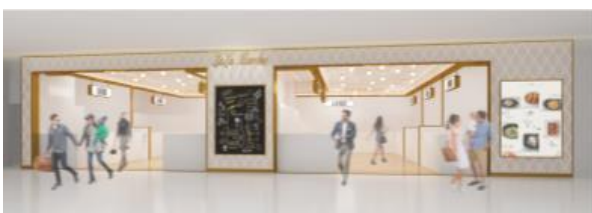
LaLa Marche CG

轻饮食·食品零售区真实还原日本地下百货的区域，其中设置了包括日本和中国的甜点店、咖啡厅等店铺。