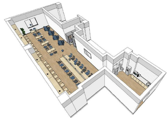
员工休息室效果图

在 LaLaport，这里重新完善了员工休息室，旨在为店铺员工创造一个舒适的工作环境并提高 ES（员工满意度）。后续还将举行联合招聘会，为店铺招聘员工提供支持。