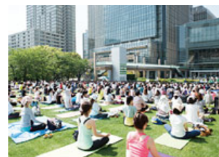
広大な緑の上で催されるさまざまなイベント