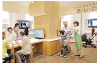
健康づくり拠点まちの健康研究所「あ・し・た」

自治体と連携した健康事業、実証実験のモデルタウンなどの取り組みを通じて、超高齢化社会に対応した街、子どもからお年寄りまで誰もが健康やかに暮らせる街をめざしています。