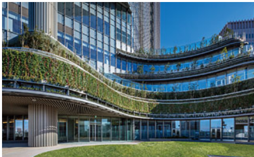
都市と公園が融合したランドスケープ