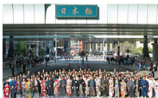
街を活性化するさまざまなイベントを実施

歴史や文化を大切にしながら、未来を見据え、時代が求める「価値創造」を行っていく。日本橋再生から日本再生をめざします。