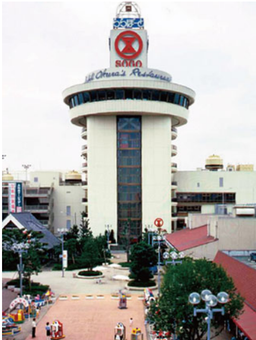
オープン当時の「ららぽーとTOKYO-BAY」（千葉県船橋市）