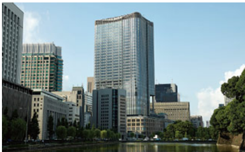
「東京ミッドタウン日比谷」(東京都千代田区)