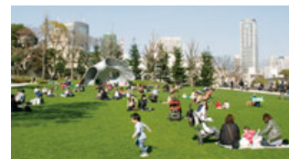
開発面積の約40%が緑あふれるオープンスペース