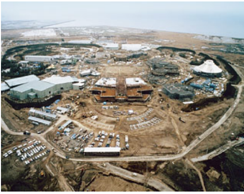
開発中の東京ディズニーランド ※事業主体：株式会社オリエンタルランド@ディズニー