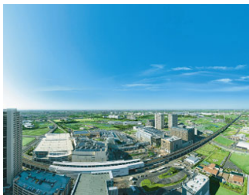
「柏の葉スマートシティ」(千葉県柏市)