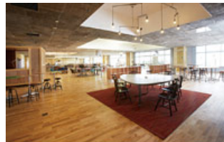
イノベーションを生み出す拠点「KOIL」 (柏の葉オープンイノベーションラボ)

新ビジネスや起業家を支援するインキュベーション施設をはじめ、大学・研究機関など知の拠点が集積。日本に新しい活力をもたらす新産業の芽を育て、サポートしています。