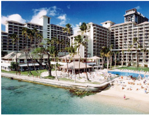
現在の「ハレクラニ」(ハワイ・オアフ島)