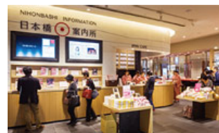
外国人コンシェルジュも常駐する「日本橋案内所」