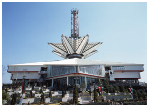
「三井アウトレットパーク大阪鶴見」(大阪市鶴見区)