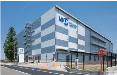
MFLP稲沢（愛知県稲沢市）※2017年竣工