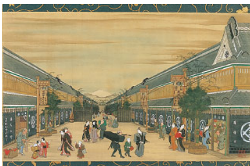
江戸時代の日本橋「越後屋」