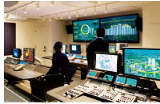
地域のエネルギーを見守る「柏の葉スマートセンター」

街全体でエネルギー利用の最適化を図ることにより、環境・エネルギー問題に応え、災害時にもライフラインを確保。世界最先端の技術で、地球環境と共生する街を実現します。