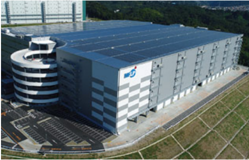
MFLP茨木（大阪府茨木市）※2017年竣工