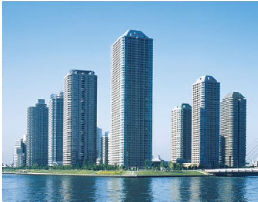
「大川端リバーシティ21」(東京都中央区)