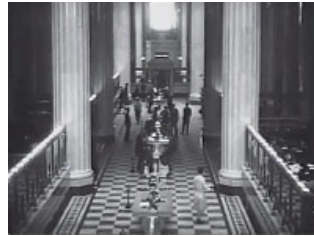
創立当時の社内の様子

1909年に設立された三井合名会社の所有不動産を管理する「不動産課」が分離独立し、1941年、三井不動産が創立されました。それ以降、三井不動産は日本の新しい国づくりに貢献するという使命感とともに、街づくりを通じた世の中への貢献を続けてきました。