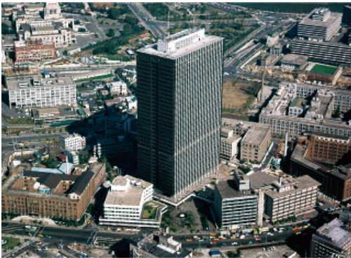
竣工当時の「霞が関ビルディング」（東京都千代田区）