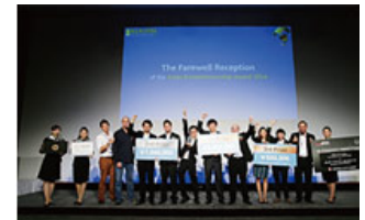
国際ビジネスコンテストも開催