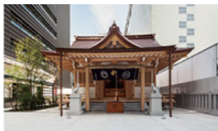
千年以上の歴史を持つ「福德神社」の社殿再建に協力

歴史に学び、先人の知恵を借りることで、失われた街の機能や人々のにぎわいなどを蘇らせる取り組みを行っています。