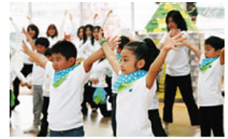
独自の健康増進プログラムも提供