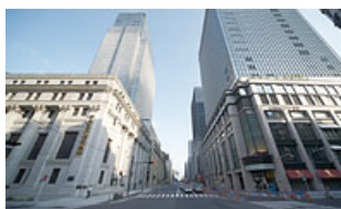
重要文化財でもある「三井本館」との調和を図った景観づくり

伝統文化や歴史的建造物、地域コミュニティなどと共生・共存し、未来へ残すことが、私たちの使命だと考えています。