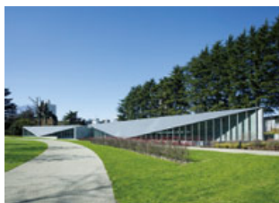
先進的なデザインを発信する 「21_21 DESIGN SIGHT」