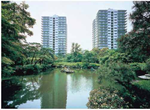
「三田綱町パークマンション」（東京都港区）