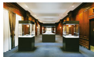
多数の美術品を収蔵する「三井記念美術館」