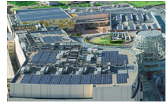
「ららぽーと柏の葉」屋上の太陽光パネル