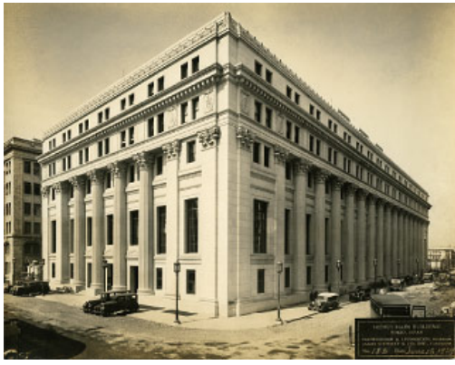
竣工当時の「三井本館」(東京都中央区)