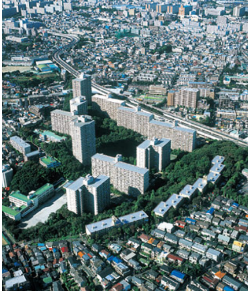
森に囲まれた現在の「サンシティ」（東京都板橋区）

「霞が関ビルディング」に続き、わが国初の高層マンション「三田綱町パークマンション」では住環境における新たな価値創造に挑戦。また分譲マンション「サンシティ」では、「経年優化」の思想が生まれました。「木々が育つように、命が集い、人と人とのつながりが増える街」をめざして、入居者などが約5万本の樹木を植樹。現在では里山のような森に育っています。この「経年優化」という思想は、現在も私たちの街づくりの中に生きています。