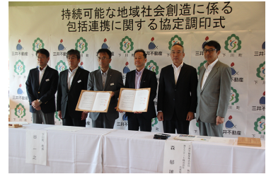
▶ 北海道下川町との協定調印式