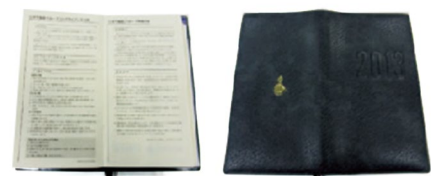
社員手帳に記載されたグループコンプライアンス方針

全社員に配布される社員手帖にグループコンプライアンス方針を明記しています。また三井不動産グループコンプライアンス方針に基づくコンプライアンス・マニュアルに定める「反社会的勢力の排除」「マネーロンダリングの防止」「不公正な取引方法（優越的地位の濫用等）の排除」「インサイダー取引の禁止」「接待・贈答」「会社情報に関する守秘義務」等をテーマとした「コンプライアンス通信」を適宜全社員に発行し、コンプライアンス遵守の強化・周知徹底に努めています。