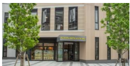
アリーナ付きフィットネス施設