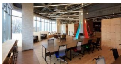
TENT 幕張（コワーキングスペース）