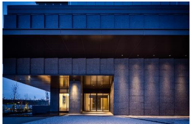
グランドエントランス