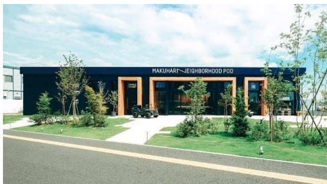
MAKUHARI NEIGHBORHOOD POD

「MAKUHARI NEIGHBORHOOD POD」は2024年3月末で閉館し、承継施設として4月1日に「MAKUHARI NEIGHBORHOOD DOCK」が誕生します。「PIE & COFFEE mamenakano」と「MAKUHARI BREWERY」が移転、その他にも幕張ベイパークにキッチンカーで出店していた企業がピザ専門店を開店、また、幕張ベイパーク内にあったBBQ施設（暫定施設）のスタッフが独立してBBQスタイルのお店を開店する等、『自分の店を持ちたいと夢をもった人達』の活躍する場として今後も街の賑わいと交流・文化を生み出す拠点として活動を続けます。