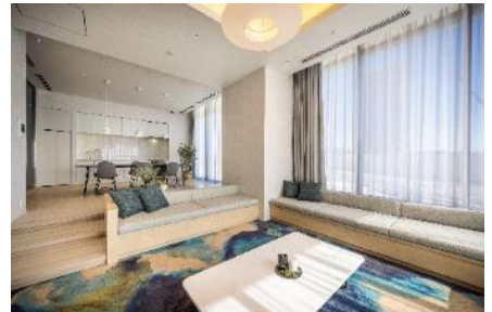
VILLA ZONE : パーティールーム