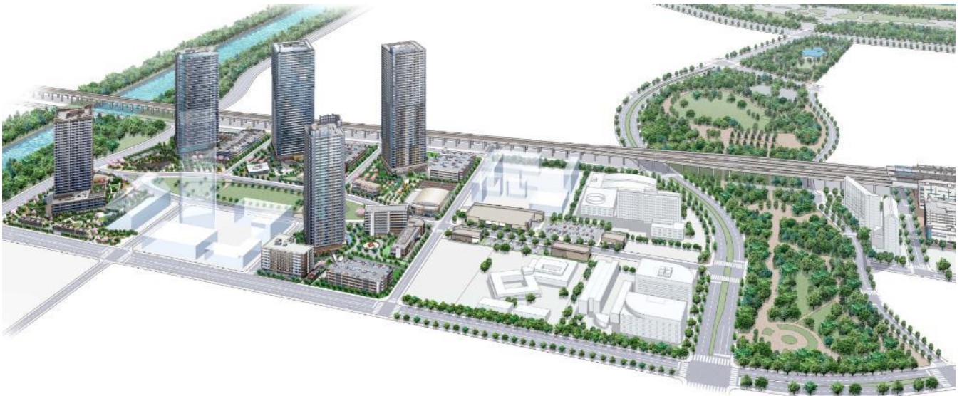
全体俯瞰イラスト