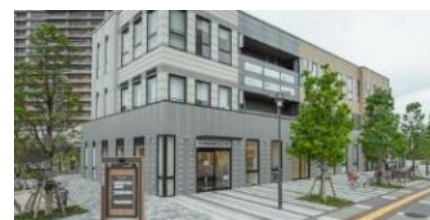
メディカルモール