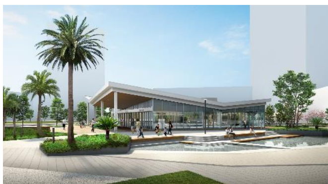
MAKUHARI NEIGHBORHOOD DOCK