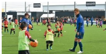
ZOZOPARK HONDA FOOTBALL AREA