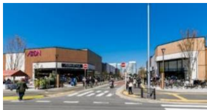
イオンスタイル幕張ベイパーク

「幕張ベイパーク」内には大型のスーパーマーケットやコンビニエンスストア、雑貨店等の買い物施設、複数の飲食施設、保育所・学童等の教育施設、アリーナ付きのフィットネス施設やサッカー・フットサル・テニス等ができるスポーツ施設、クリニックが入居するメディカルモール、自由な働き方を提供するコワーキング施設等が揃っており、日常生活を便利で快適に過ごせるようミクストユースの開発に取り組んでおります。