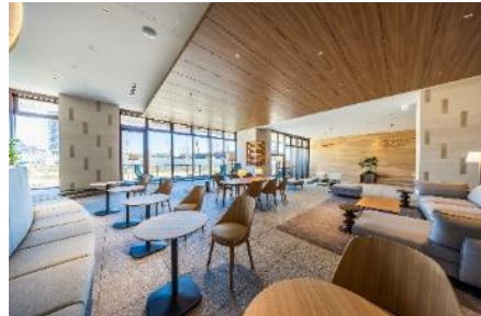
BEACH ZONE : コモンラウンジ