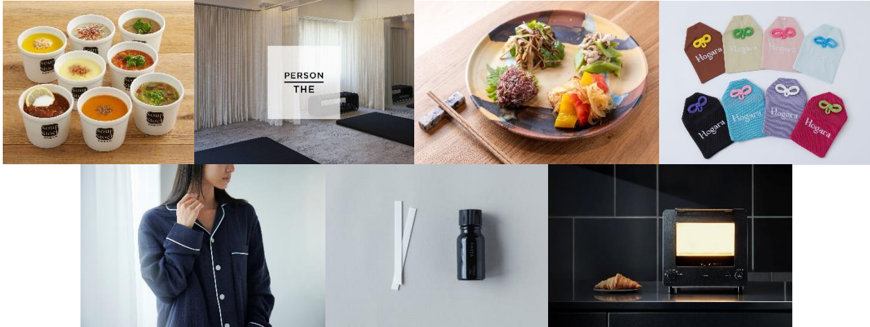
コラボレーション イメージ

※一部有料のサービスがございます。また、提携内容は今後変更となる場合があります。