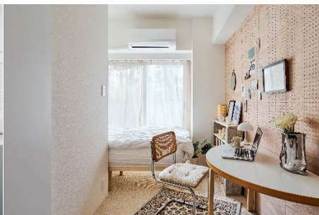
居室（モデルルーム）