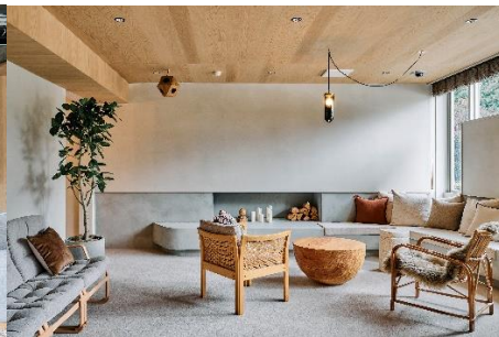
ファイヤープレース