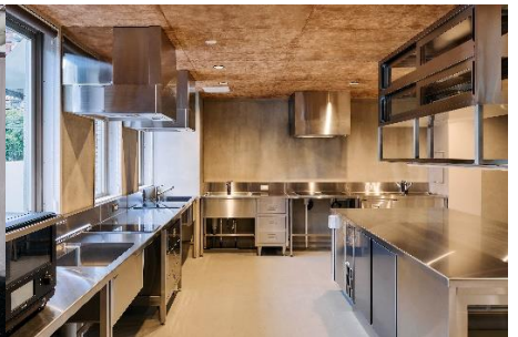
キッチンスタジオ