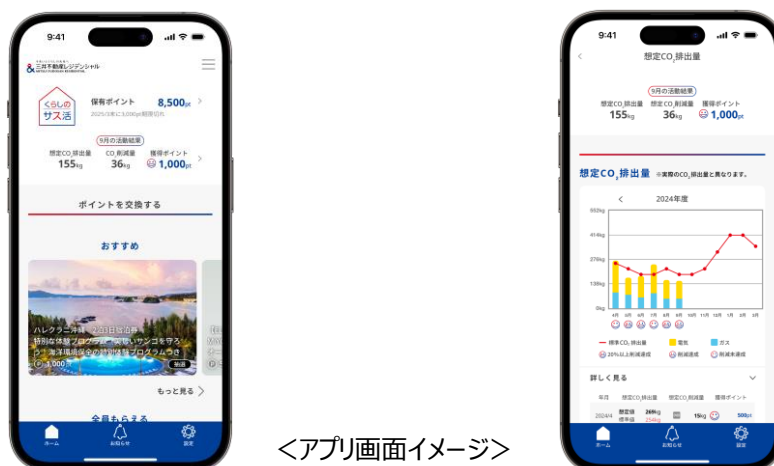
<アプリ画面イメージ>

本アプリは、三井不動産レジデンシャルの首都圏の新築分譲マンションで導入を開始しており、今後、首都圏で展開する新築分譲物件および過去分譲物件 24 万世帯に向けて順次拡大することで、お客様が日々のくらしを豊かに、楽しみながら、持続的に CO2 削減を推進出来る環境を提供していきます。