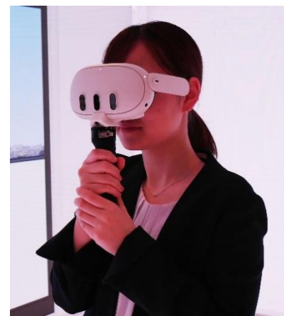
「Meta Quest 3」を装着した様子