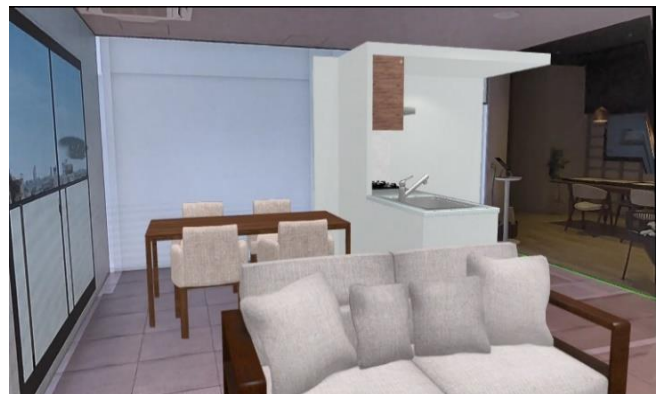
VRモデルルーム上にMRを用いて3D家具を投影した様子