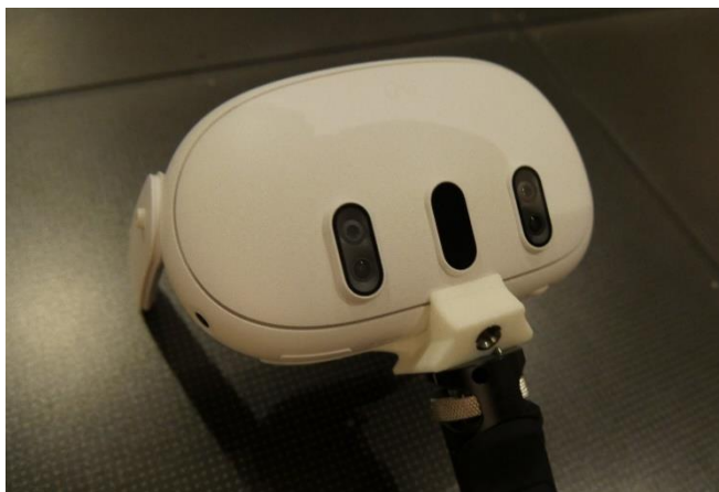
「Meta Quest 3」の製品画像

「Meta Quest 3」は、Meta 社のリアリティーラボ部門が開発した MR ヘッドセットです。世界初のマスマーケット向け MR ヘッドセットであり、様々な没入体験を可能にする画期的な複合現実を特徴としています。なお、投影する家具キッチン等およびその CG を空間へ投影するアプリケーションについては、パナソニック システムデザイン株式会社に制作協力をいただいております。