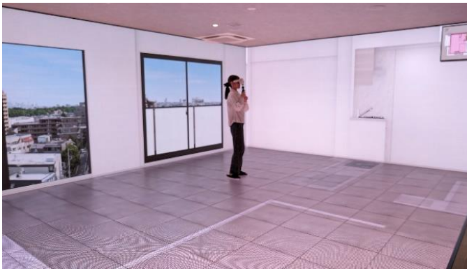
本サロンでの VR モデルルームの様子（2 次元）