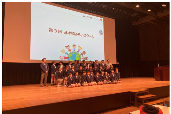
当日の様子（日本橋三井ホール）