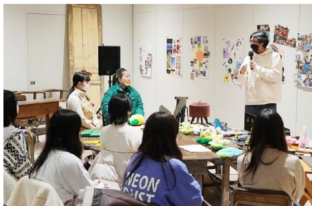
GAKU「グラフィックデザインのパス」