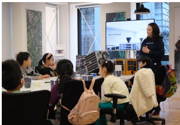
あつまれキッズ！宇宙の仕事ワークショップ

江戸時代の日本橋は寺子屋や私塾が多く、当時の東京市内でも有数の文教エリアでした。明治時代に入ってすぐの頃には地元の人達の熱意と努力によって中央区内最初の学校が誕生しました。日本橋は商人の街でもあったことから、商売に必要な読み書き・計算などを子ども達に教えるために、街の大店が資金を持ち寄って子どもたちに学びの場を提供していたという歴史もあります。