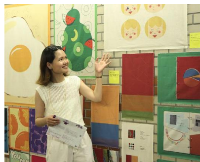
作品展示会の様子（日本橋の昭和通り地下歩道・江戸桜通り地下歩道で実施）