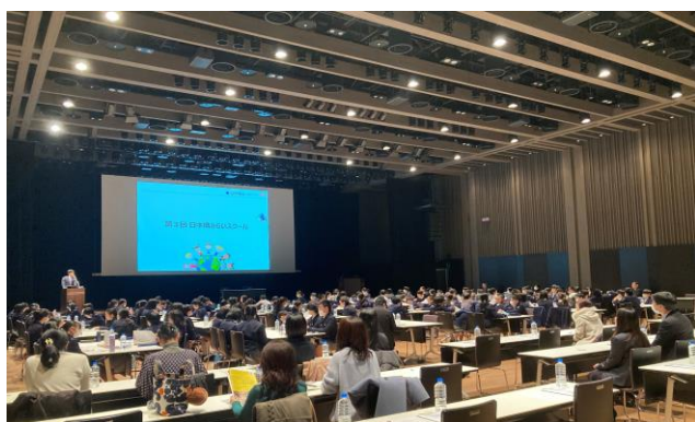
日本橋みらいスクール2023

三井不動産株式会社（本社：東京都中央区、代表取締役社長：植田俊、以下「三井不動産」）は、一般社団法人日本橋室町エリアマネジメントとともに、日本橋エリアにおいて地域のプレイヤーと継続的に連携を図りながら、子どもたちの未来の可能性を広げるプロジェクト「日本橋 次世代教育 プロジェクト（以下、「本プロジェクト」）」を実施しています。本プロジェクトを通して、未来を担う子どもたちが、広く深く世界を知るきっかけを創出することに取り組んでいます。2023年度は4つのプロジェクトを実施し、延べ約1,000人にご参加いただきました。