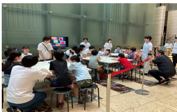
日本橋キッズサマーキャンプ2023