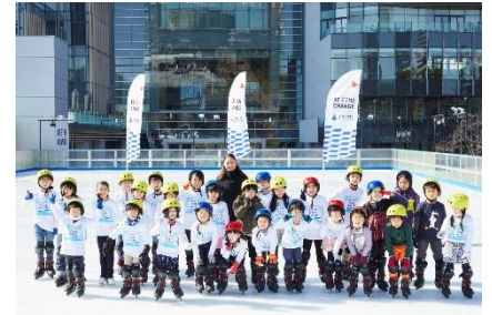
三井不動産スポーツアカデミー (アイススケートアカデミー)