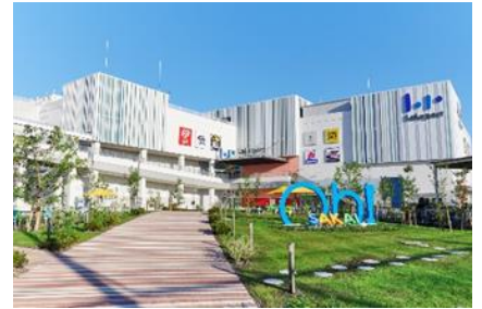
三井ショッピングパーク ららぽーと堺 (大阪府堺市)