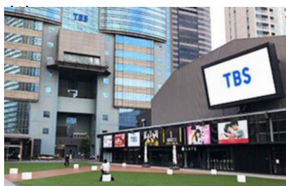
TBS 放送センター前 赤坂サカス広場

[特設サイト] https://pickleballpark.jp/nihonbashi/