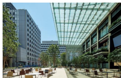
COREDO 室町テラス 大屋根広場