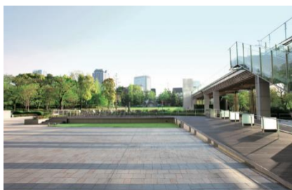
東京ミッドタウン コートヤード