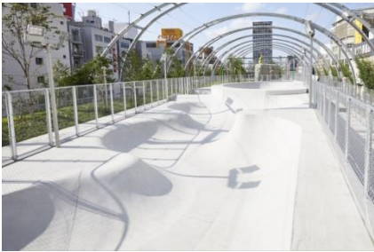
MIYASHITA PARK (東京都渋谷区)

三井不動産は、2016年から「BE THE CHANGE」というスローガンを掲げ、スポーツの要素を盛り込んださまざまな街づくりを手掛けてまいりました。ボルダリングウォールやスケート場などを備えた「MIYASHITA PARK」、200m陸上トラックなどを含むスポーツパークを有する「三井ショッピングパーク ららぽーと福岡」、本格的なスポーツ・エンターテインメントイベントが実施可能な屋内型スタジアムコートを有する「三井ショッピングパーク ららぽーと堺」などの『場』を整えるとともに、子どもたちがアスリートの1DAYのレッスンを受けられる「三井不動産スポーツアカデミー」などのイベント実施をはじめとした『コミュニティ』づくりを進めており、その取り組みを加速しています。また、2024年春には収容人数1万人規模の大型多目的アリーナ施設「LaLa arena TOKYO-BAY」(株式会社MIXIとの共同事業)の開業も控えており、今後も「スポーツの力」を活用した街づくりを推進してまいります。