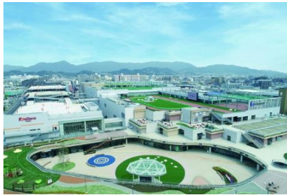
三井ショッピングパーク ららぽーと福岡 (福岡県福岡市)