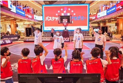
三井不動産スポーツアカデミー (バスケットボールアカデミー)