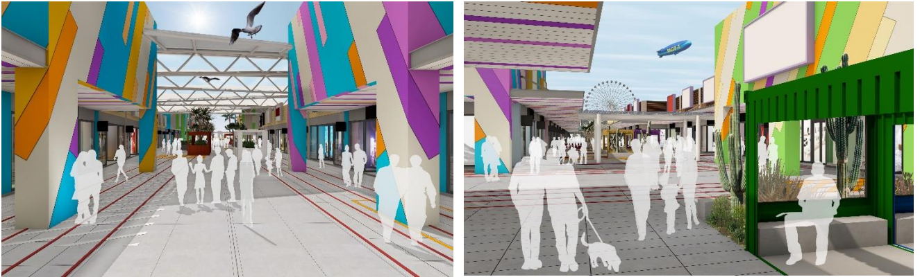
《二期繽紛外觀參考示意圖》

台灣首座海港型購物商城「MITSUI OUTLET PARK 台中港」得天獨厚的天然海景依傍，設施內規劃以貨櫃、港灣碼頭等熟悉的海洋元素融入在設施的各個角落，全區採低樓層開放式空間設計，寬廣舒適的公共空間，加上全台唯一的 60 公尺高海景摩天輪、望海觀景台、創意貨櫃市集等重新詮釋海港印象。除了吸引家庭族群購物兼休閒娛樂之外，近年儼然成為中部地區年輕族群約會、網紅外拍的新景點。此次的二期計畫更在外觀設計上加上玩色小巧思，讓原有的海岸風情更增添亮艷色彩。