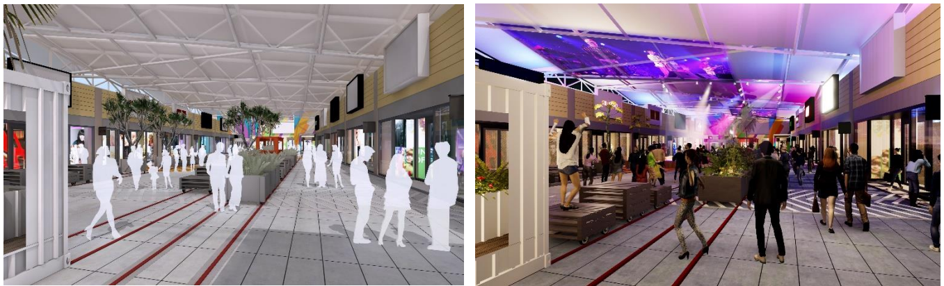
《公共區域參考示意圖》

來到 MITSUI OUTLET PARK 台中港除了能體驗多元的服務與多樣化的購物樂趣外，附近更有許多中台灣最著名的觀光景點，包括高美濕地、台中都會公園、大甲鎮瀾宮、逢甲夜市、路思義教堂、鹿港天后宮、彩虹眷村及秋紅谷廣場，並可品嚐太陽餅、清水米糕、東海雞腳凍、南屯麻芋、大甲芋頭酥等地小吃，結合購物、玩樂、休閒、美食等各種優勢，輕鬆規劃台中一日遊輕旅行，時尚生活與海線風光全部一次享受！